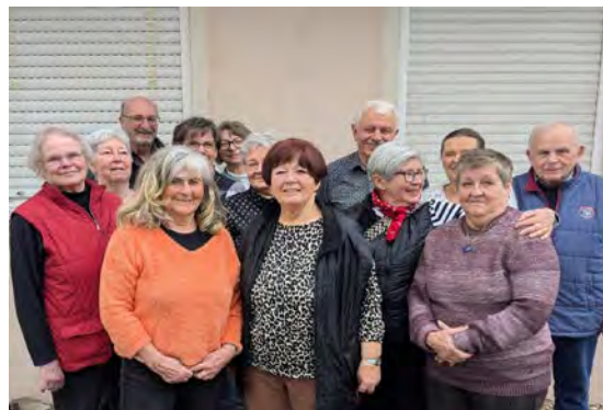
Das Schatzkiste Team