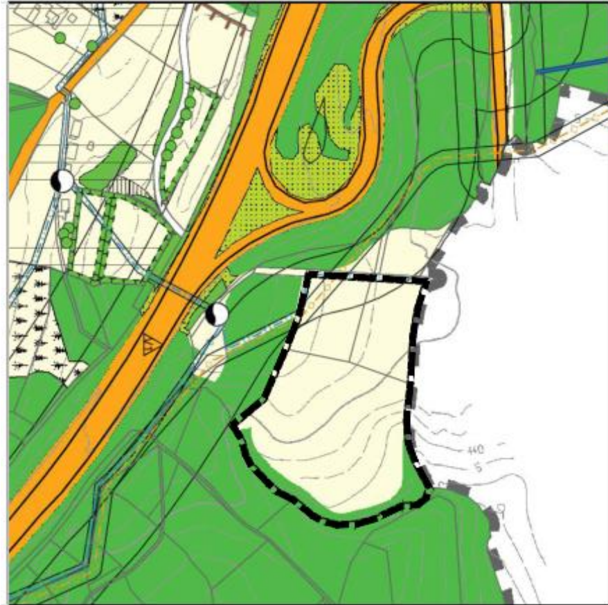
bisher rechtswirksamer Stand des Flächennutzungsplans m. Integr. Landschaftsplan