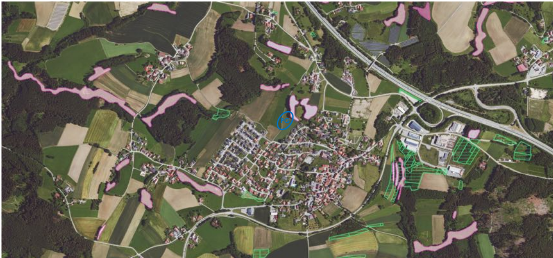
Luftbildausschnitt von Garham aus FIS-Natur Online des LfU mit Daten der Biotopkartierung (rot), Ökoflächen des Ökoflächenkatasters (grün) und Planungsgebiet (PG, blau), Geobasisdaten: © Bayerische Vermessungsverwaltung