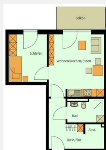
2-Zimmer-Wohnung mit Balkon 53,68 m 2 128.000.- €

Es entsteht ein KfW-Effizienzhaus 70 (EnEV 2009) mit einer Energietechnik nach neuestem Standard.